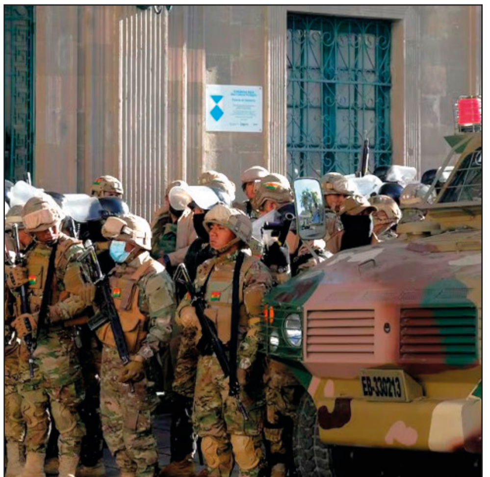
El 26 de junio del año pasado un grupo de militares protestaron contra el Gobierno de Luis Arce

Ribera desvirtuó su participación en la revuelta militar y adelantó que iniciará su defensa en la vía judicial. “No nos van a amedrentar”, manifestó Ribera en un video que circula en redes sociales.