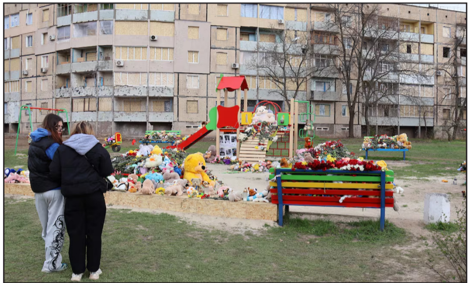
PELUCHES Y FLORES EN EL PARQUE DE KRIVÓI ROG SOBRE EL QUE RUSIA LANZÓ UN MISIL EL PASADO 4 DE ABRIL, MATANDO A 11 ADULTOS Y NUEVE NIÑOS.