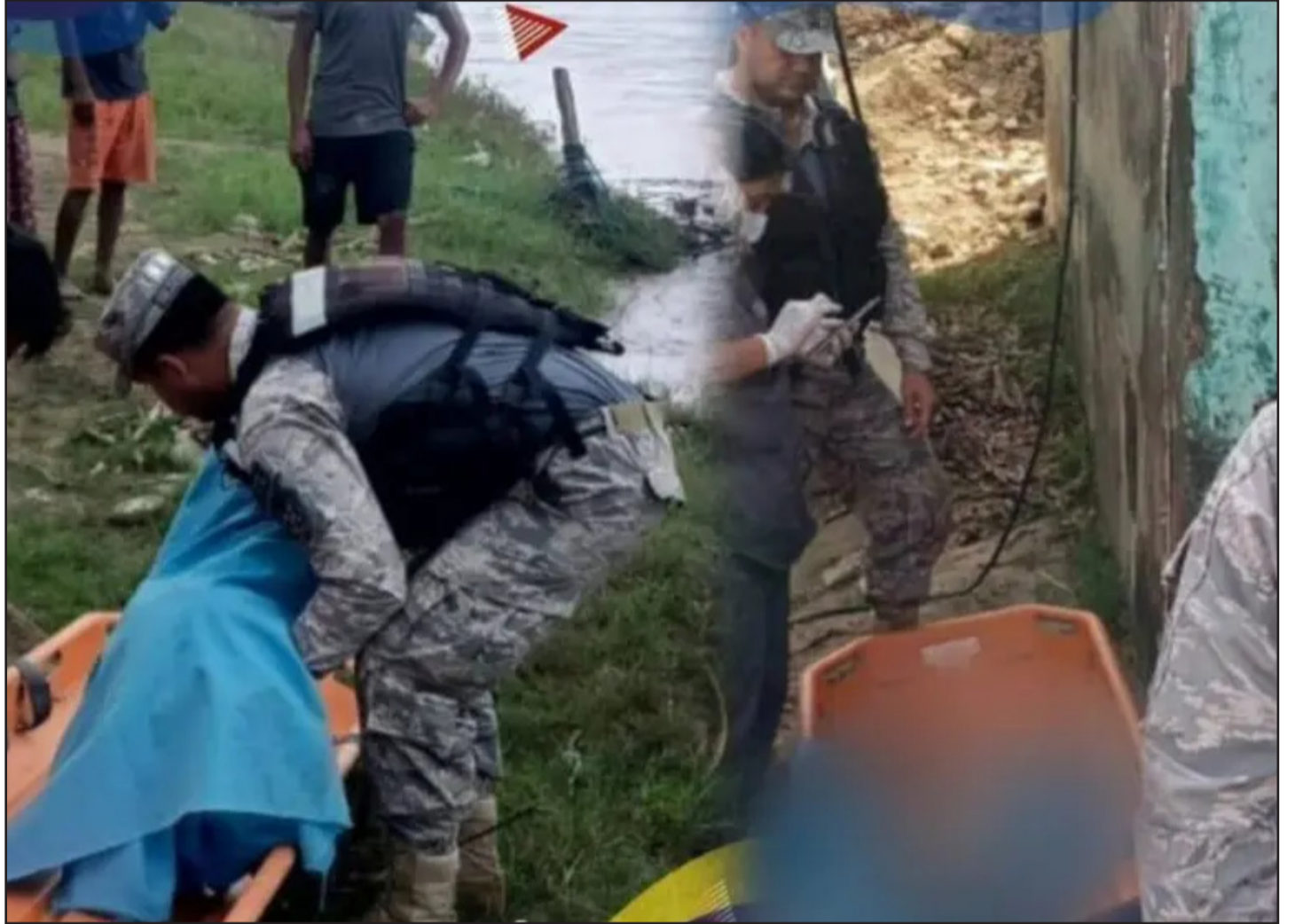
EFFECTIVOS DE LA ARMADA, DURANTE EL RESCATE DEL CUERPO SIN VIDA DE UN BEBÉ. ARMADA BOLIVIANA

El hecho ocurrió este pasado sábado a las 14:20, en el sector conocido como "El Susse", a dos kilómetros, río arriba. Según reportes, la familia se dedicaba a la producción de plátanos.