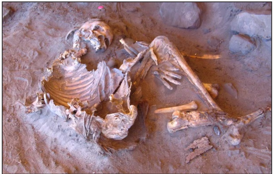
UN CADÁVER EN EL YACIMIENTO DE TAKARKORI, AL SUR DE LIBIA.

naje ‘fantasma’ que situamos en el Sahel, pero no parece que estos individuos lo representen. Esto solo indica lo poco que sabemos de las poblaciones antiguas de África”, añade el científico.