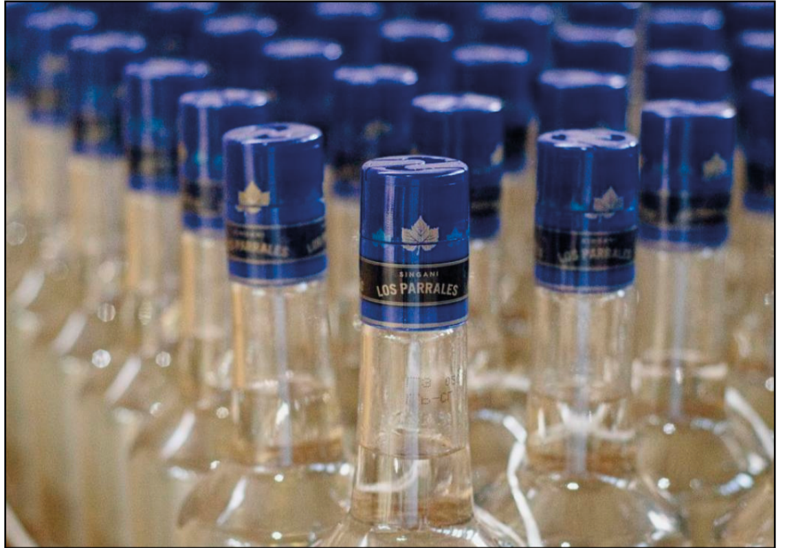
Tarija exporta singani al mercado estadounidense

El gobierno boliviano, a través de un comunicado de la Cancillería, rechazó la decisión del gobierno de Donald Trump de subir los aranceles a los productos que importa debido a